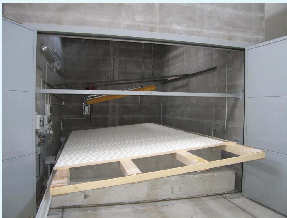
Fotografia del campione, lato camera emittente.