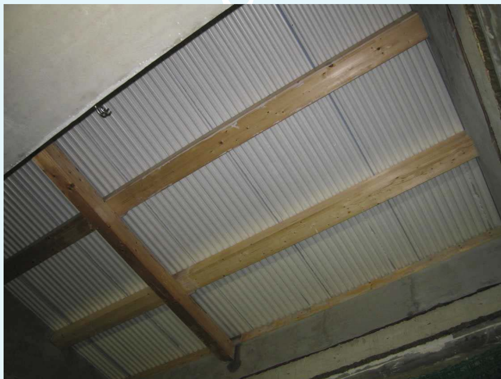
Fotografia del campione, lato camera ricevente.

Photograph of sample, receiving room side.